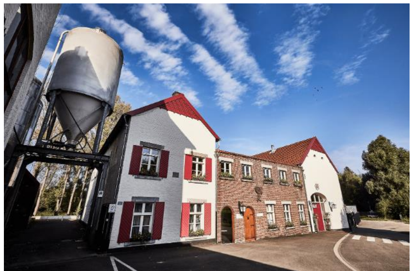
Zicht op de oude Alfa brouwerij

Vervolgens reden we met onze auto's naar de Alfa brouwerij in Schinnen alwaar we omstreeks 15.00 uur verwacht werden.