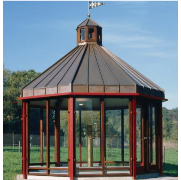
Brongebouwtje voor de brouwerij

Jammer genoeg hadden we te maken met een zeer norse gids, werknemer van de brouwerij, die van oordeel was dat de toehoorders op tijd moesten komen. Die begon dan ook stipt om 15.00 uur met de al aanwezige andere 11 ingeschreven deelnemers. Onze leden kwamen vervolgens 2 per 2 aan bij de brouwerij en dienden aan te sluiten bij de groep. We leerden intussen dat de brouwerij bestaat sinds 1870 en oorspronkelijk de naam van de familie "Meens" droeg. Joseph Meens stichtte in 1870 in buurtschap Thull vlak bij Schinnen de Meens Bierbrouwerij. De brouwerij werd gecombineerd met een boerderij. Het brouwen van bier en het verkopen van bierbostel leverde een beter inkomen op. Aanvankelijk maakte men hooggegist bieren, rond de eeuwwisseling schakelde de brouwerij over op het 'Beiersch' bier, bier van ondergisting. Tot 1960 werd Alfa-bier alleen in de omgeving gedronken. Daarna raakte het in het hele land verkrijgbaar. De familie brouwt intussen 5 generaties lang met dezelfde zorg en toewijding en ondanks herhaalde pogingen hebben ze nooit de drang gevoeld de fabriek te verkopen aan de grotere broertjes.