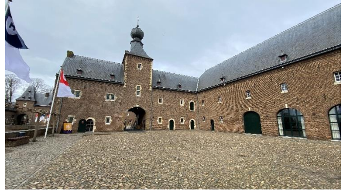
(Zicht op het grote binnenplein van Kasteel Hoensbroek)

Bij een lekkere koffie en een vooraf gekozen en besteld broodje werden de contacten tussen de diverse leden aangehaald en werden nieuwtjes en roddels uitgewisseld.