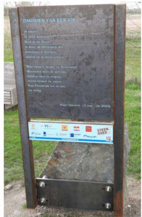
Het gedicht werd gelaserd op een cortenstaalplaat die dan bevestigd werd op een grote maaskei

Vervolgens reden we enkele kilometers verder naar pompstation Ciro in Ophoven, Kinrooi.