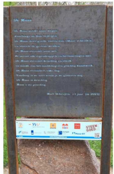
Onder het gedicht vindt u een overzicht van de sponsors en organiserende verenigingen